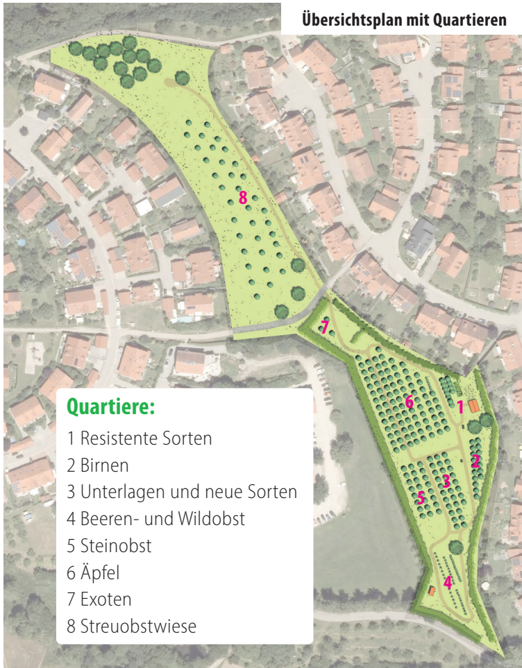
Übersichtsplan mit Quartieren

Mit einer Gesamtfläche von ca. 22.000 m 2 ist der Garten in verschiedene Quartiere eingeteilt. Besucher erwarten über 260 Gehölze mit weit mehr als 100 verschiedenen Obstsorten.