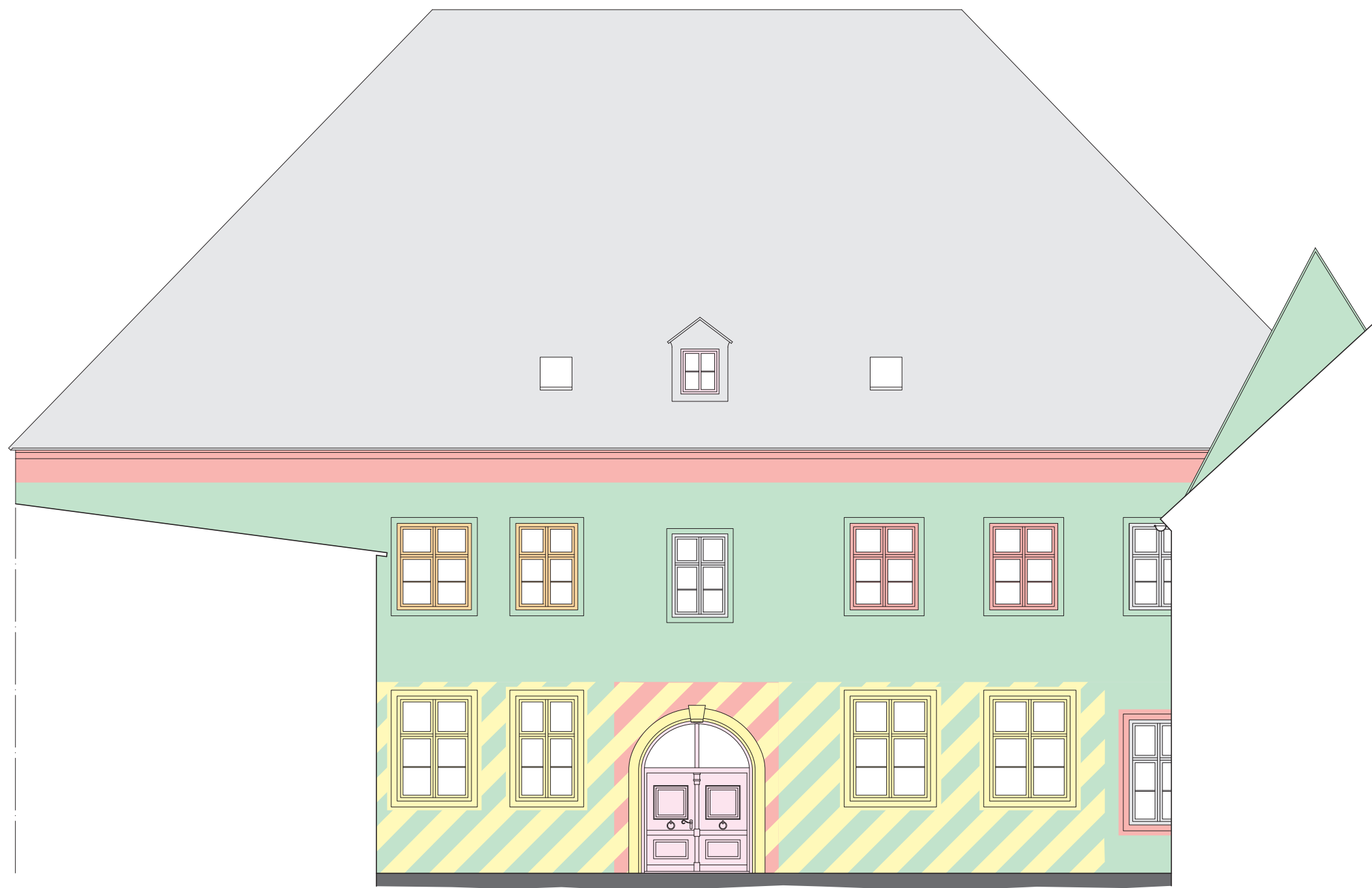
Ansicht W Innenhof